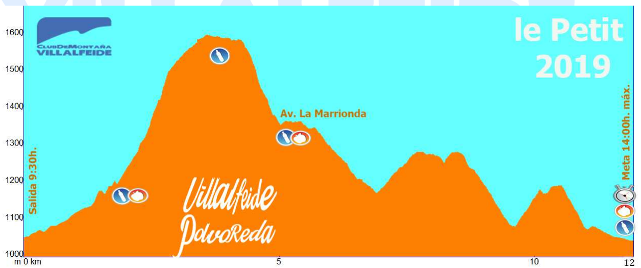
Perfil LE PETIT Villalfeide Polvoreda 2019